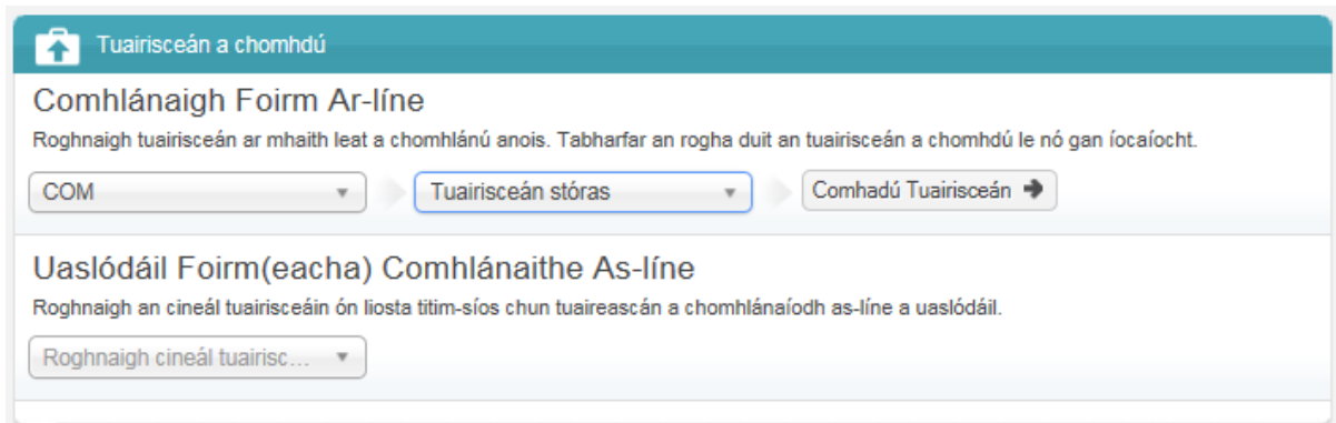
Fíor 3 - Leathanach Baile Tuairisceán a Thíolacadh ROS

Tar éis logáil isteach ar ROS, féadfaidh úsáideoirí tús a chur leis an bpróiseas tíolactha tuairisceáin tríd an gcineál cánach COM a roghnú ón roghchlár anuas; ansin an 'Tuairisceán Stórais' a roghnú; agus ansin cliceáil ar an gcnaipe 'Tíolaic Tuairisceán' mar a léirítear ar an léaráid thíos.