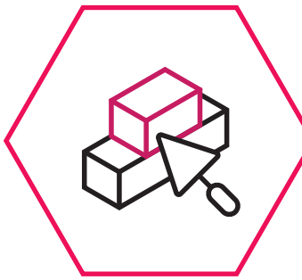
Cáin Brící 1784